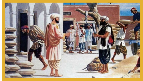
ਗੁਰੂ ਜੀ ਮੋਦੀਖਾਨੇ ਵਿੱਚ ਲੈਣ-ਦੇਣ ਕਰਦਿਆਂ

ਨਾਨਕ ਜੀ ਦੀ ਨਿਯੁਕਤੀ ਨਾਲ ਸਾਰੇ ਵਰਗ ਹੌਲੀ-ਹੌਲੀ ਸੰਤੁਸ਼ਟ ਹੋ ਗਏ। ਨਾ ਕਿਸੇ ਨੂੰ ਘੱਟ ਨਾ ਕਿਸੇ ਨੂੰ ਵੱਧ ਅਨਾਜ ਮਿਲਦਾ। ਤੋਲ ਵਿੱਚ ਤਾਂ ਘੱਟ ਹੋਣ ਦਾ ਸੁਆਲ ਹੀ ਨਹੀਂ ਸੀ। ਕਿਉਂਕਿ ਲੈਣ ਅਤੇ ਦੇਣ ਵਾਲੇ ਸਾਰੇ ਵੱਟੇ ਇੱਕੋ ਤੋਲ ਦੇ ਹੋ ਗਏ ਸਨ। ਨਾਨਕ ਜੀ ਆਪ ਅਪਣੇ ਹੱਥੀਂ ਸਾਰੇ ਅਨਾਜ ਨੂੰ ਵੱਡੇ ਕੰਡੇ ਤੇ ਤੁਲਵਾ ਕੇ ਲੈਂਦੇ ਅਤੇ ਦੇਂਦੇ।