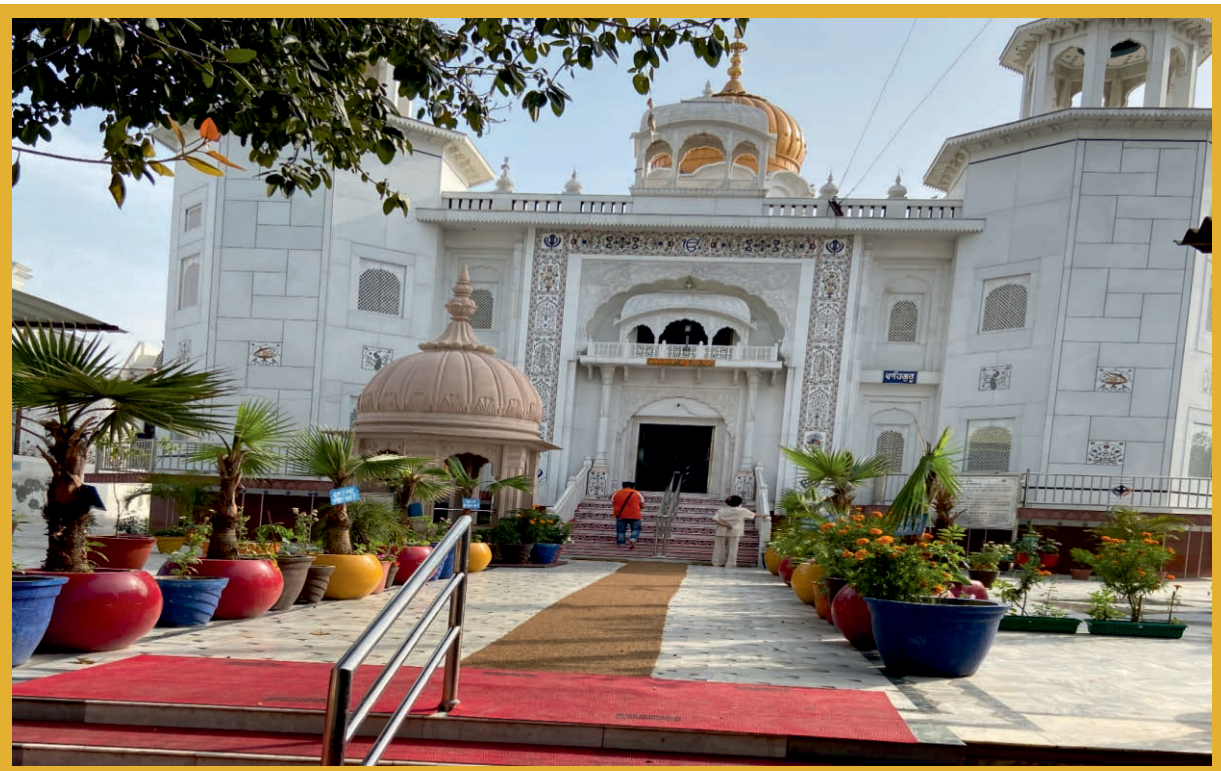
ਗੁਰਦੁਆਰਾ ਗੁਰੂ ਕਾ ਬਾਗ, ਸੁਲਤਾਨਪੁਰ ਲੋਧੀ (ਗੁਰੂ ਜੀ ਦਾ ਨਿਵਾਸ ਅਸਥਾਨ।)

ਗੁਰੂਦੇਵ ਜੀ ਦੇ ਪਿਤਾ ਜੀ, ਕੁਝ ਦਿਨ ਸੁਲਤਾਨਪੁਰ ਲੋਧੀ ਰਹਿ ਕੇ ਨਾਨਕ ਦੇਵ ਜੀ ਦੀ ਘਰ ਗ੍ਰਿਸਤੀ ਵਸਾ ਕੇ ਤਲਵੰਡੀ ਵਾਪਸ ਮੁੜ ਗਏ। ਗੁਰੂ ਜੀ ਨੇ ਆਪਣੇ ਪਰਿਵਾਰ ਦੇ ਰਹਿਣ ਲਈ ਇਕ ਵਖਰਾ ਘਰ ਬਣਵਾ ਲਿਆ, ਜਿੱਥੇ ਅਜਕਲ ਗੁਰਦੁਆਰਾ ਗੁਰੂ ਕਾ ਬਾਗ ਸੁਸ਼ੋਬਤ ਹੈ।