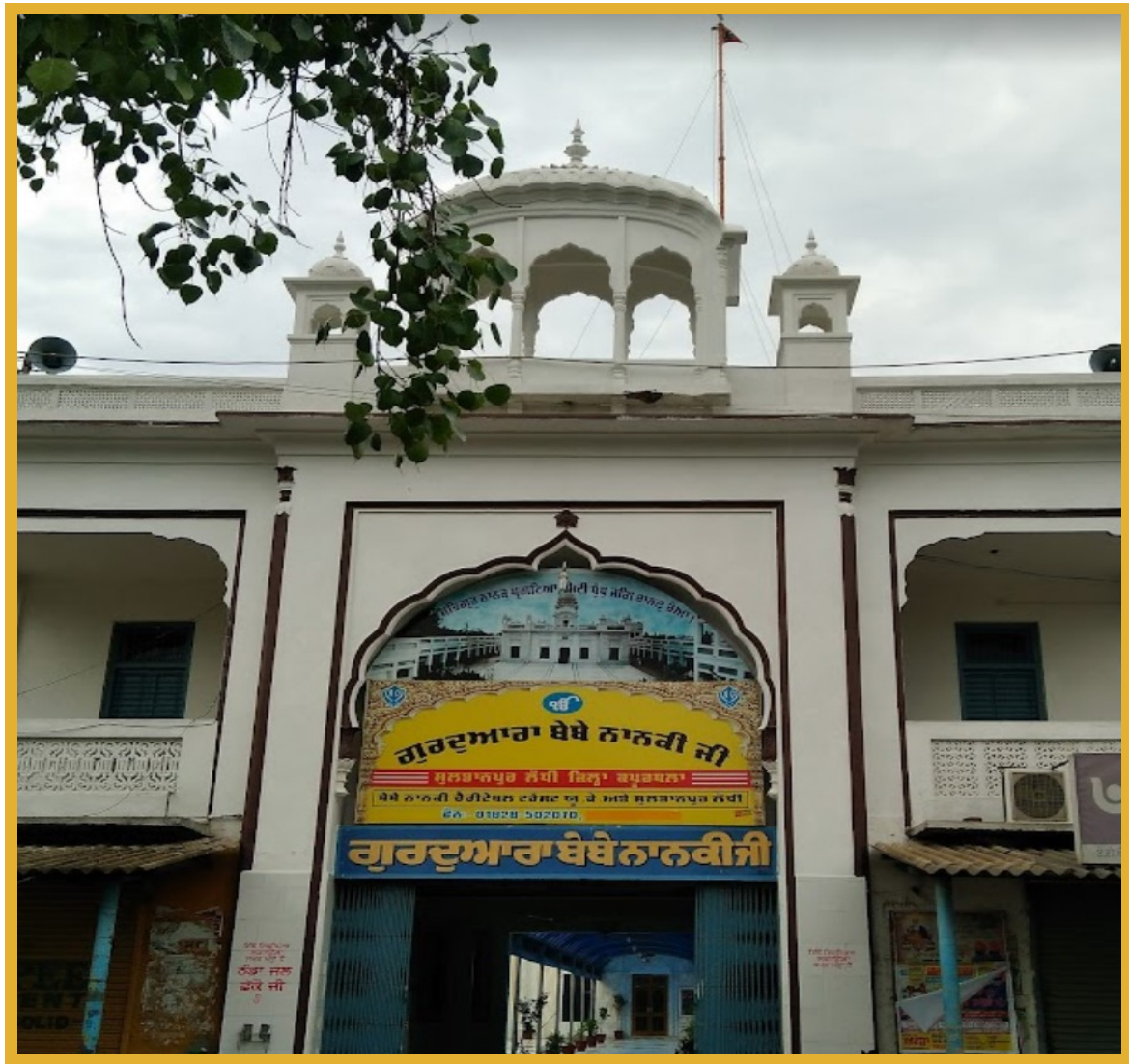
ਸੁਲਤਾਨਪੁਰ ਲੋਧੀ (ਪੰਜਾਬ)