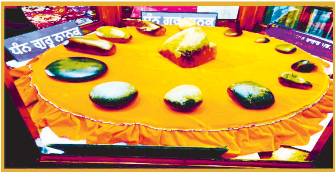
ਗੁਰਦੁਆਰਾ 'ਹੱਟ ਸਾਹਿਬ, ਦੇ ਅੰਦਰ ਉਹ ਵੱਟੇ, ਜਿਨ੍ਹਾਂ ਨਾਲ ਗੁਰੂ ਜੀ ਤੋਲਿਆ ਕਰਦੇ ਸਨ। ਅੱਜ ਵੀ ਉਸੇ ਰੂਪ ਵਿੱਚ ਸੰਭਾਲੇ ਹੋਏ ਹਨ।