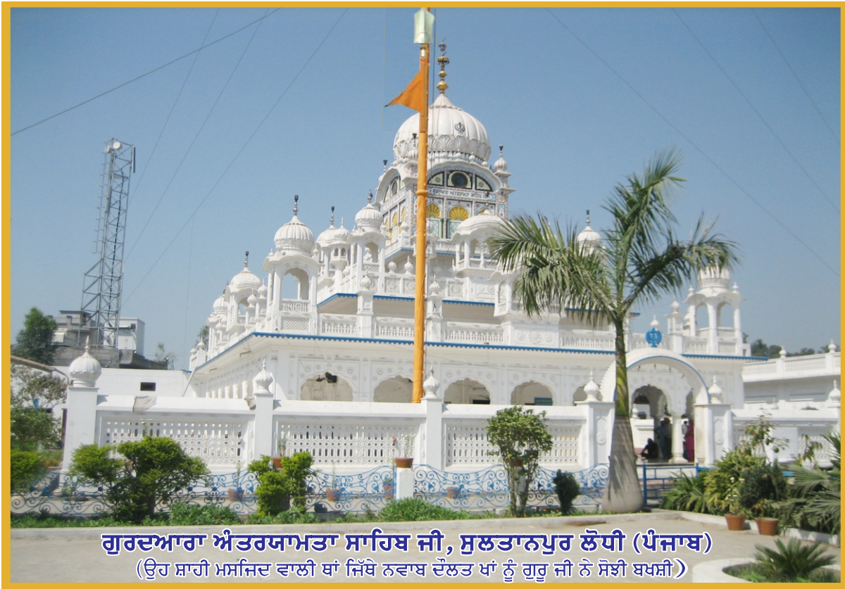
ਗੁਰਦਆਰਾ ਅੰਤਰਯਾਮਤਾ ਸਾਹਿਬ ਜੀ, ਸੁਲਤਾਨਪੁਰ ਲੋਧੀ (ਪੰਜਾਬ) (ਉਹ ਸ਼ਾਹੀ ਮਸਜਿਦ ਵਾਲੀ ਥਾਂ ਜਿੱਥੇ ਨਵਾਬ ਦੌਲਤ ਖਾਂ ਨੂੰ ਗੁਰੂ ਜੀ ਨੇ ਸੋਝੀ ਬਖਸ਼ੀ)

ਜਿਉਂ ਹੀ ਗੁਰੂ ਜੀ ਦੇ ਸਸੁਰ ਬਾਬਾ ਮੂਲ ਚੰਦ ਜੀ ਨੂੰ ਪਤਾ ਲੱਗਾ ਕਿ ਨਾਨਕ ਜੀ ਆਪਣੇ ਮਿਸ਼ਨ ਦੇ ਪ੍ਰਚਾਰ ਹਿੱਤ ਲੰਮੀ ਫੇਰੀ ਤੇ ਜਾ ਰਹਿ ਹਨ। ਤਾਂ ਉਹ ਨਾਨਕ ਦੇਵ ਜੀ ਨੂੰ ਸਮਝਾਉਣ ਲਈ ਆਪਣੇ ਨਾਲ ਆਪਣੇ ਗੁਰੂ, ‘ਸ਼ਾਮੇ ਪੰਡਿਤ’ ਨੂੰ ਲੈ ਕੇ ਸੁਲਤਾਨਪੁਰ ਲੋਧੀ ਆ ਪਹੁੰਚੇ।