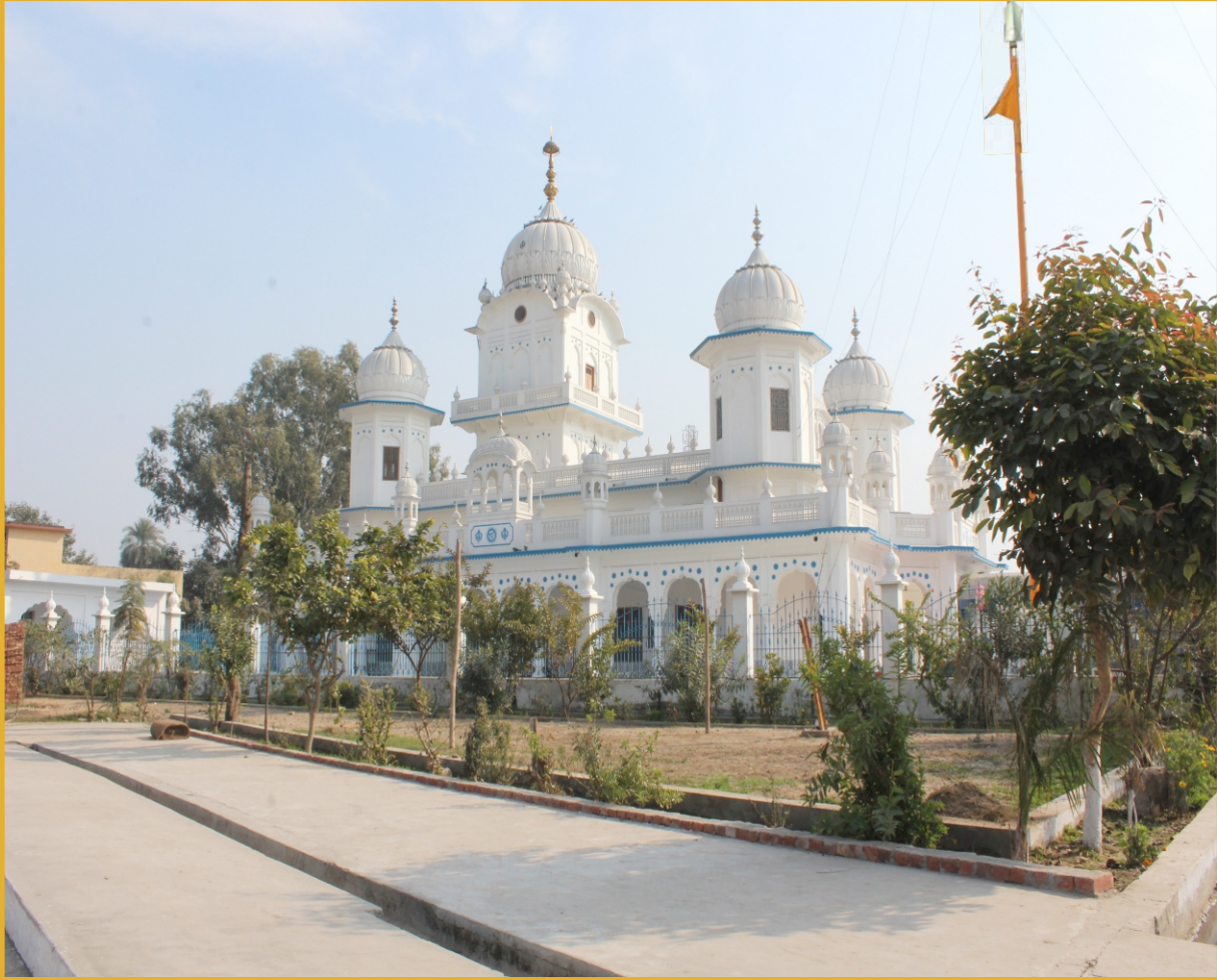
ਮੋਦੀਖਾਨੇ ਵਾਲੇ ਅਸਥਾਨ ਤੇ ਗੁਰਦੁਆਰਾ 'ਹੱਟ ਸਾਹਿਬ, ਸੁਸ਼ੋਭਤ ਹੈ (ਸੁਲਤਾਨਪੁਰ ਲੋਧੀ)