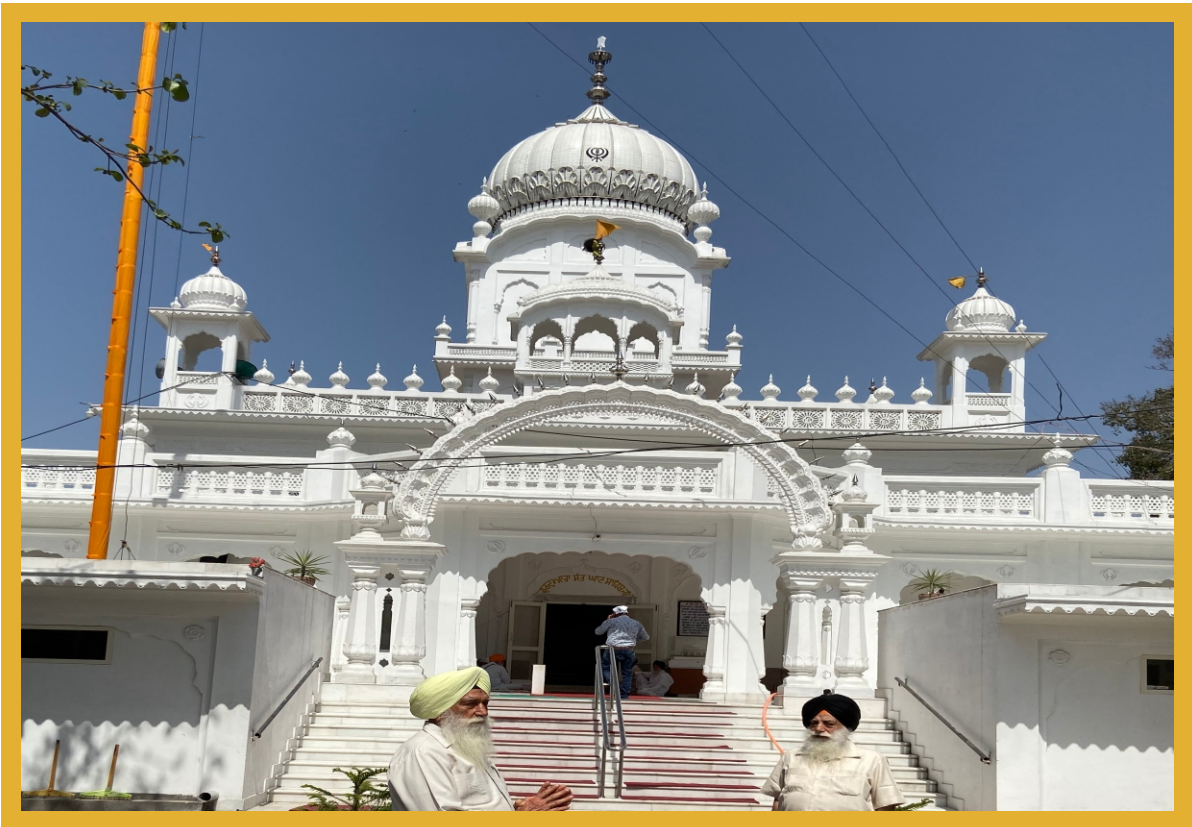
ਗੁਰਦੁਆਰਾ ਸੰਤਘਾਟ, ਸੁਲਤਾਨਪੁਰ ਲੋਧੀ (ਪੰਜਾਬ)