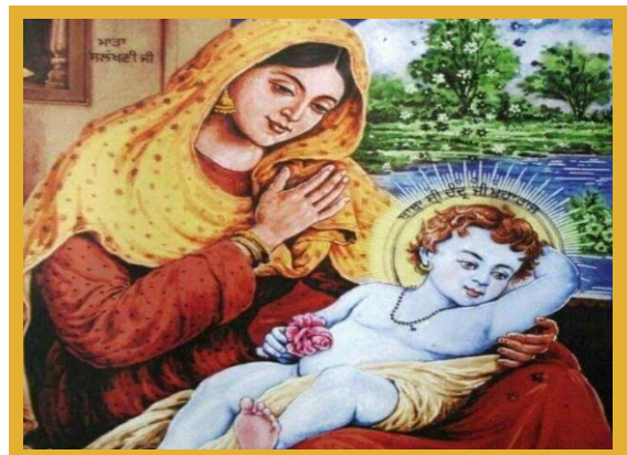
ਬਾਲਕ ਸ੍ਰੀ ਚੰਦ, ਮਾਤਾ ਸੁਲੱਖਣੀ ਜੀ ਦੀ ਗੋਦ ਵਿੱਚ

ਨਾਨਕ ਦੇਵ ਜੀ ਦੇ ਘਰ 8 ਸੰਤਬਰ 1494 ਈ: ਨੂੰ ਪੁੱਤਰ ਨੇ ਜਨਮ ਲਿਆ। ਤਲਵੰਡੀ ਤੋਂ ਮਾਤਾ ਪਿਤਾ ਜੀ ਨੇ ਆ ਕੇ ਉਸ ਦਾ ਨਾਮ ‘ ਸ੍ਰੀਚੰਦ ’ ਰੱਖਿਆ। ਬਟਾਲਾ ਤੋਂ ਬਾਬਾ ਮੂਲਚੰਦ ਜੀ ਆਪਣੀ ਪਤਨੀ ਸਮੇਤ, ਵਿਅੰਮ ਨਾਲ ਸੰਬੰਧਿਤ ਵਸਤੂਆਂ ਵੀ ਲੈ ਕੇ ਆਏ। ਸੁਲਤਾਨਪੁਰ ਵਾਸੀ ਨਾਨਕ ਜੀ ਦੇ ਘਰ ਪੁੱਤਰ ਆਉਣ ਦੀਆਂ ਵਧਾਈਆਂ ਦੇਣ ਆਉਣ ਲਗੇ। ਦੌਲਤਖਾਂ ਲੋਧੀ ਅਤੇ ਸਾਰੇ ਦਰਬਾਰੀਆਂ ਨੇ ਵੀ ਵਧਾਈ ਦਿੱਤੀ। ਮਾਤਾ ਸੁਲੱਖਣੀ ਜੀ ਅਤੇ ਬੇਬੇ ਨਾਨਕੀ ਜੀ ਵਧਾਈ ਦੇਣ ਵਾਲਿਆਂ ਨੂੰ ਖੁਸ਼ੀ ਖੁਸ਼ੀ ਲੱਭੂ ਵੰਡਦੇ ਨਾ ਥੱਕਦੇ।