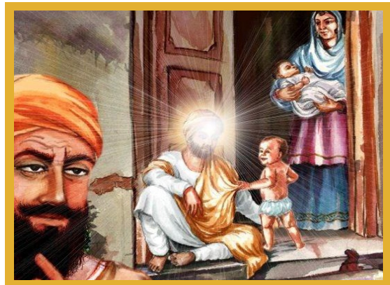
ਬਾਲਕ ਸ੍ਰੀ ਲਖਮੀਦਾਸ, ਮਾਤਾ ਸੁਲੱਖਣੀ ਜੀ ਦੀ ਗੋਦ ਵਿੱਚ

ਗੁਰੂ ਨਾਨਕ ਦੇਵ ਜੀ ਦੇ ਗ੍ਰਹਿ ਵਿਖੇ ਫਰਵਰੀ 1497 ਈ.: ਲੱਖਮੀ ਚੰਦ ਦਾ ਜਨਮ ਹੋਇਆ। ਤਲਵੰਡੀ ਤੋਂ ਨਾਨਕ ਜੀ ਦੇ ਮਾਤਾ ਪਿਤਾ ਜੀ ਨੇ ਆ ਕੇ ਆਪਣੇ ਦੂਜੇ ਪੋਤੇ ਦਾ ਨਾਮ ਲੱਖਮੀ ਚੰਦ ਰੱਖਿਆ। ਬਟਾਲਾ ਤੋਂ ਮੂਲਚੰਦ ਜੀ ਪਰਿਵਾਰ ਸਮੇਤ ਲੋੜੀਂਦੀਆਂ ਵਸਤੂਆਂ ਲੈ ਕੇ ਆਏ। ਸੁਲਤਾਨਪੁਰ ਵਾਸੀਆਂ, ਸੰਗੀਸਾਬੀਆਂ, ਨਵਾਬ ਅਤੇ ਉਸ ਦੇ ਸਾਰੇ ਕਰਮਚਾਰੀਆਂ ਨੇ ਵਧਾਈਆਂ ਦਿੱਤੀਆਂ। ਪਰਿਵਾਰ ਵਲੋਂ ਖੁਸ਼ੀਆਂ ਮਨਾਉਂਦਿਆਂ ਸਭਨਾਂ ਨੂੰ ਮਿਠਾਈਆਂ ਵੰਡੀਆਂ ਗਈਆਂ।