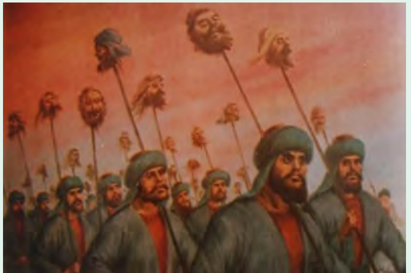
ਲਾਹੌਰ ਦੇ ਨਵਾਬ ਜ਼ਕੀਆਖਾਨ ਦੇ ਫੌਜੀਆਂ ਨੇ ਪਿੰਡਾ ਅਤੇ ਦਿਹਾਤਾਂ ਵਿੱਚੋਂ ਆਮ ਗਰੀਬ ਸਿੱਖਾਂ ਦੀ ਹਤਿਆ ਕਰ ਕੇ ਉਨ੍ਹਾਂ ਦੇ ਸਿਰ ਦਿੱਲੀ ਲੈ ਜਾਂਦੇ ਹੋਏ।

ਲਾਹੌਰ ਤੋਂ ਦਿੱਲੀ ਰਵਾਨਾ ਕਰਦੇ ਸਮੇਂ ਇਨ੍ਹਾਂ ਸਾਰੇ ਸਿੱਖਾਂ ਦੀ ਬਹੁਤ ਦੁਰਗਤੀ ਕੀਤੀ ਗਈ। ਸਭਿਅਕ ਸਮਾਜ ਵਿਚ ਅਜਿਹੀ ਕਰਤੂਤ ਜਾਹਿਲ ਅਤੇ ਅਰਧ ਜੰਗਲੀ ਜੇਤੂਹੀ ਕਰ ਸਕਦੇ ਹਨ। ਬੰਦਾ ਸਿੰਘ ਵਾਂਗ ਹੀ ਇਸ ਵਾਰੀ ਸਾਰੇ ਕੈਦੀਆਂ ਨੂੰ ਲੋਹੇ ਦੀਆਂ ਜੰਜੀਰਾਂ ਵਿਚ ਜਕੜਿਆ