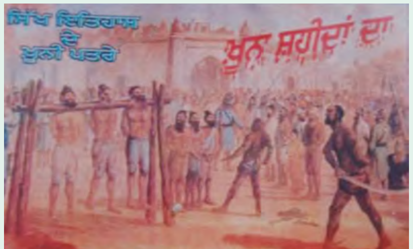
ਬਾਦਸ਼ਾਹ ਫਰੂਕਸ਼ੀਅਰ ਦੁਆਰਾ ਬੰਦਾ ਸਿੰਘ ਦੇ ਸਾਥੀਆਂ ਸਿੱਖ ਕੈਦੀਆਂ ਨੂੰ ਕਾਜ਼ੀ ਇਸਲਾਮ ਸਵੀਕਾਰ ਕਰਣ ਲਈ ਮਜ਼ਬੂਰ ਕਰ ਰਿਹਾ ਹੈ ਨਹੀਂ ਤਾਂ ਗਲੇ ਵਿਚ ਬੈਠਾਂ ਦਾ ਫੰਦਾ ਪਾ ਕੇ ਮਿਰਤੂ ਦੰਡ ਦਿੱਤਾ ਜਾ ਰਿਹਾ ਹੈ। ਭਾਵ ਫਾਂਸੀ ਦਿੱਤੀ ਜਾ ਰਹੀ ਹੈ।