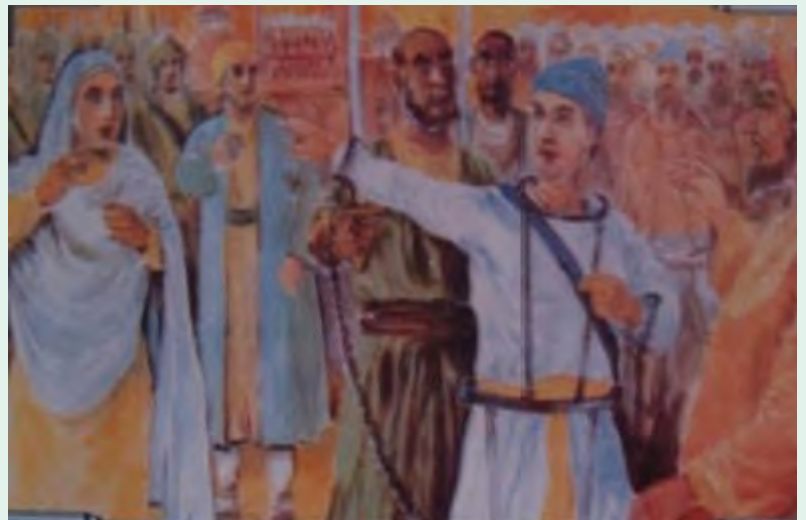
ਕੈਦੀ ਸਿੱਖ ਯੁਵਕ ਨੇ ਕਿਹਾ ਮੇਰੀ ਮਾਤਾ ਬੁਠ ਬੋਲ ਰਹੀ ਹੈ, ਮੈਂ ਸਿੱਖ ਹੀ ਹੈ, ਮੈਨੂੰ ਖਿਮਾ ਨਹੀਂ ਚਾਹਿਦੀ ਜੇਕਰ ਮਾਫ ਕਰਨਾ ਹੀ ਹੈ ਤਾਂ ਸਾਨੂੰ ਸਾਰੀਆਂ ਨੂੰ ਬਿਨਾਂ ਸ਼ਰਤ ਮਾਫ ਕਰ ਦਿਤਾ ਜਾਵੇ।

ਇਹ ਸਿੱਖ ਕੈਦੀ ਜਿਨ੍ਹਾਂ ਉਤੇ ਬਗਾਵਤ ਦਾ ਦੋਸ਼ ਸੀ, ਮੌਤ ਸਵੀਕਾਰ ਕਰਦੇ ਸਮੇਂ ਜਿਸ ਹੌਸਲੇ ਅਤੇ ਸਾਹਸ ਨਾਲ ਭਰਪੂਰ ਸਨ, ਇਹ ਅਦੁਭੁਤ ਅਤੇ ਵਚਿੱਤਰ ਘਟਨਾ ਹੈ। ਕਿਉਂਕਿ ਅਜਿਹਾ ਨਹੀਂ ਹੁੰਦਾ ਆਮ ਕਰਕੇ ਡਰ